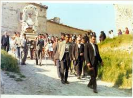
Foto tomada hacia 1968. La Virgen de Capilludos recorre desde la Iglesia en procesión el pueblo. Puede observarse la vestimenta tradicional castellana de los más viejos.