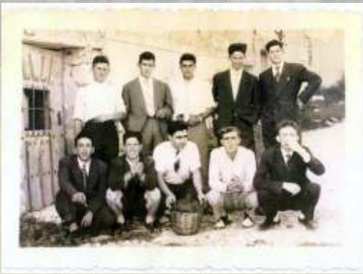
Cuadrilla de mozos amigos, principios de la década de 1960.