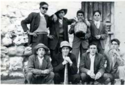
Cuadrilla de amigos, principios de la década de 1960.