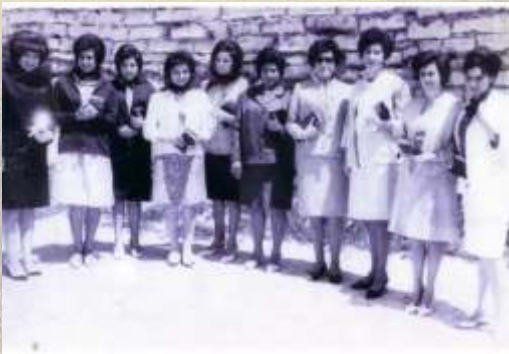
Señoritas a la salida de misa. Principios de la década de 1960.