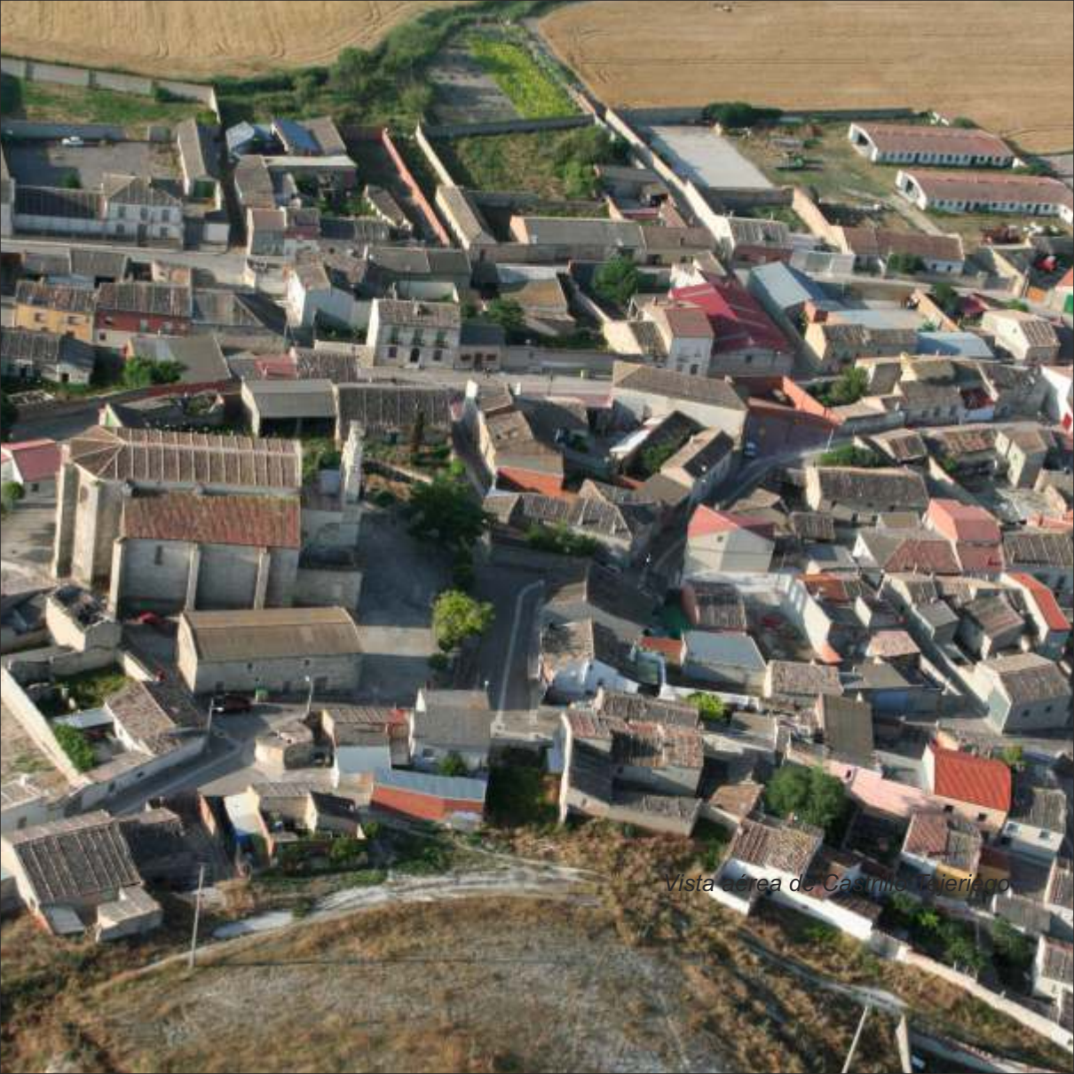
Vista aérea de Casimiro Azariego