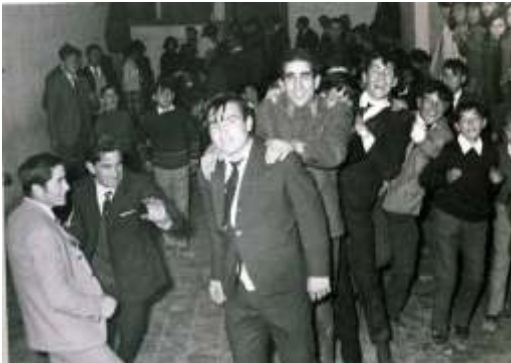
Foto en el salón del baile, hacia 1966. Los chicos están bailando la conga en fila.