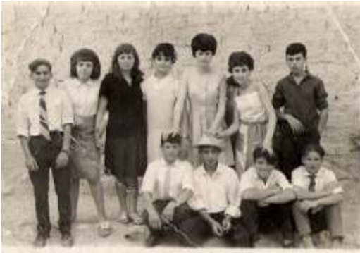
Pandilla de chicos y chicas jóvenes. Hacia 1965 .