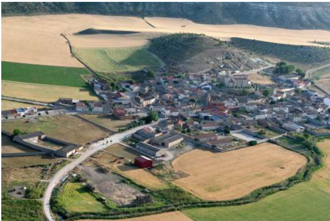
Vista aérea de Castrillo Tejeriego