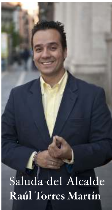
Saluda del Alcalde Raúl Torres Martín

También en estas fiestas debemos recordar a los que no están físicamente con nosotros y que también hubieran disfrutado como seguro que hicieron cuando compartían mesa y mantel con todos nosotros. También por ellos ¡Viva las Fiestas y viva la Virgen de Capilludos!